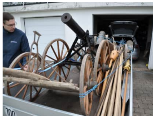
Burg Sulzberg Aufnahmen am 10. Mai 2024