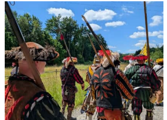
Aufmarsch zum Überfall auf die Bauern. Schwäbisches Freilichtmuseum Illerbeuren