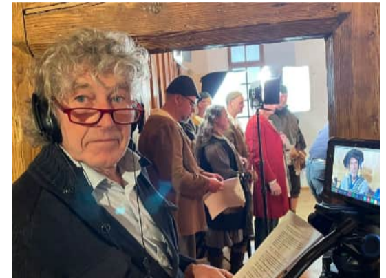
Antoniter-Museum in Memmingen am 25. Januar 2024