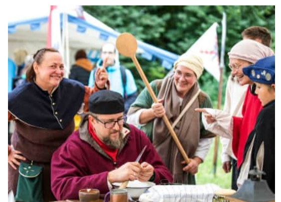
Das begehbare Feldlager des Landknechtstross 1504 e.V. bietet allen Besucherinnen und Besuchern einen Einblick in das Lagerleben.