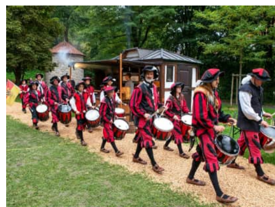
Die Kaiser Maximilian Trommler ziehen von der Burghalde bis zum Altstadtpark.