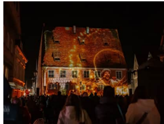
Audiovisuelle Show (Mapping) an der Fassade der Kramerzunft

Es ist sinnvoll, ein Projekt auch im Verlauf immer wieder an geänderte Rahmenbedingungen anzupassen und weiterentwickeln.