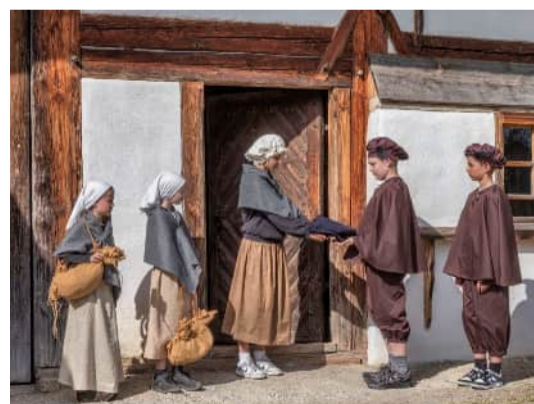
Die Witwe zahlt das beste Hemd im Todesfall des Mannes