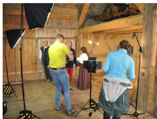
Aufnahmen in Illerbeuren Museum am 15. September 2024