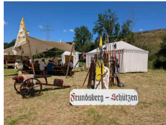
Die Frundsberg Schützen im Schwäbisches Freilichtmuseum Illerbeuren, Foto: Wohlgemut