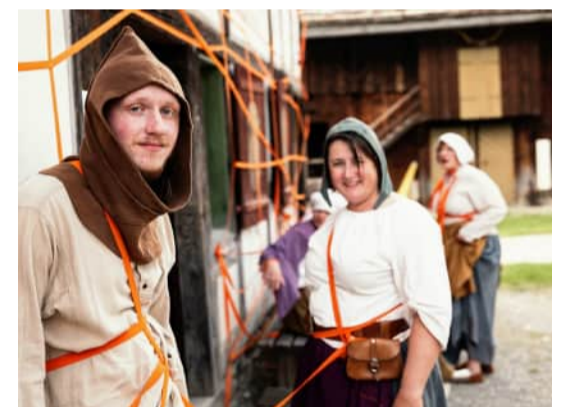
Forderung zur Aufhebung der Leibeigenschaft, Schwäbisches Freilichtmuseum Illerbeuren