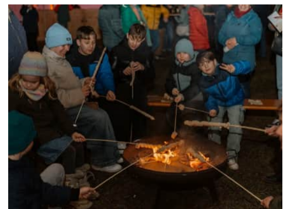
Get-together am Martin-Luther-Platz mit Stockbrot, Dinnete, dem Freiheitsbrot und Feuerschalen