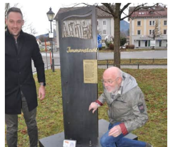
Kunstwerk Immenstadt Freie Bauern