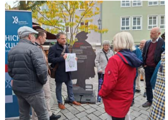
Mitglieder der GO beim historischen Stadtspaziergang Memmingen