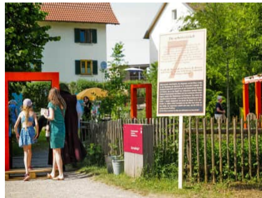
Übermäßige Frondienste, Schwäbisches Freilichtmuseum Illerbeuren