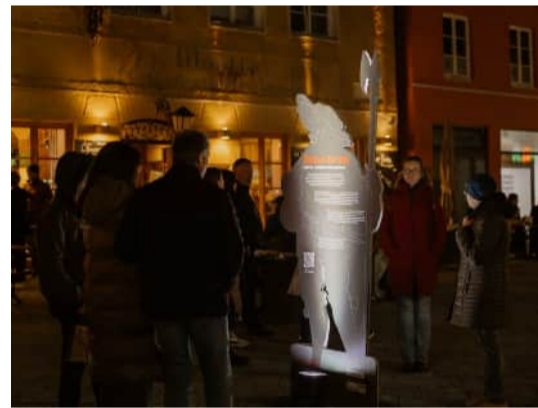
Menschen 1525 präsentiert durch den Historischen Verein e.V.