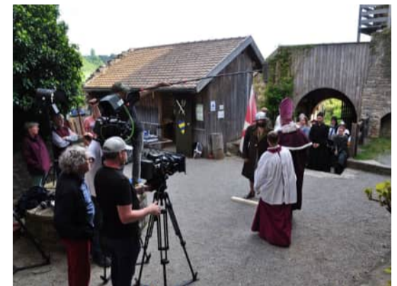
Burg Sulzberg Aufnahmen am 10. Mai 2024