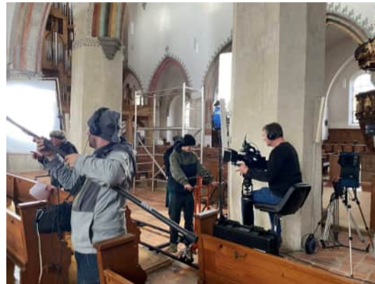
St. Martin in Memmingen am 25. November 2023