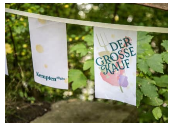
Wimpel zur Veranstaltung „Der große Kauf“.