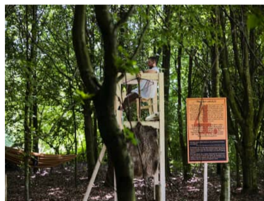
Jagdverbot, Schwäbisches Freilichtmuseum Illerbeuren