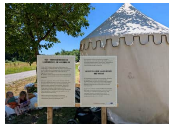
Infotafeln zu Frundsberg und Bauernkrieg, Schwäbisches Freilichtmuseum Illerbeuren