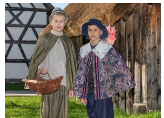
Die Kinder spielen die Bauern und Adeligen