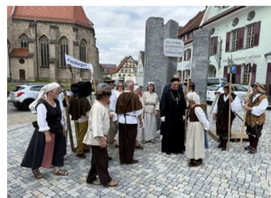
Kunstwerk Obergünzburg Enthüllung am 4.7.2025