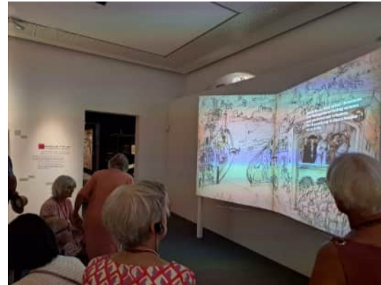
Die Mitglieder der GO in der Großen Landesausstellung