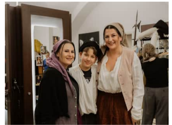
Fotospot im Lotzerhaus mit dem Landestheater Schwaben