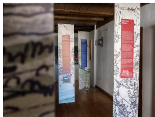
Ausstellung Leutkircher Künstler:innen inspiriert von der Murer-Chronik