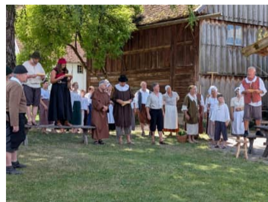
Die Bauernartikel – Aufführung des Heimatdienst Illertal, Schwäbisches Freilichtmuseum Illerbeuren