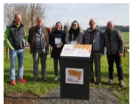
Stelen im Ostallgäu: Eggental, Baisweil, Pforzen, Lauchdorf, Ingenried, Oberdorf