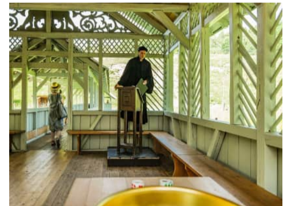
Kegeln für einen (un)fairen Richterspruch, Schwäbisches Freilichtmuseum Illerbeuren