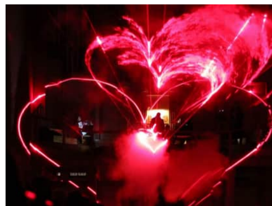
«In mein Herz» multimediale Live-Performance mit Licht und Musik in der Kirche St. Martin