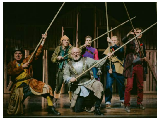
Theater Lindenhof: eigenes Stück „Wenn nicht heute, wann dann!“