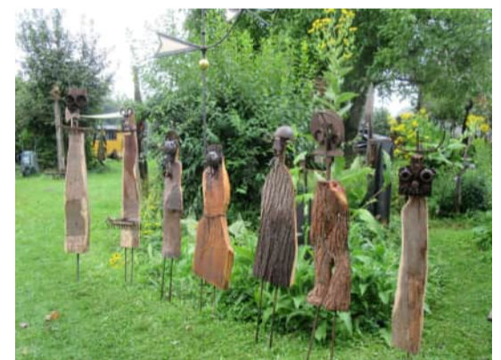
Ergebnisse des Schulprojektes