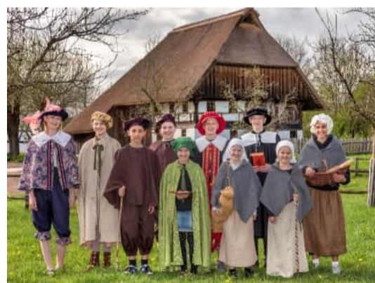
Die Schülerinnen und Schüler schlüpfen in verschiedene Rollen