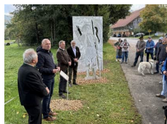
Kunstwerk Schönau Jörg Beck