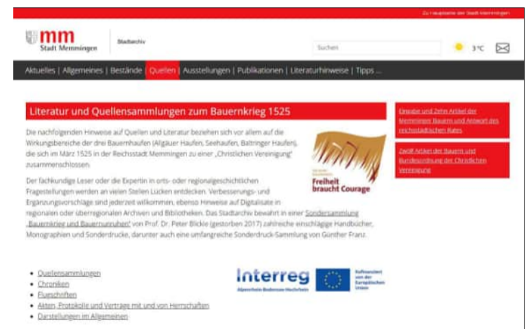
Online Bibliografie - Bauernkrieg in der Region