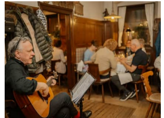
Kneipenkonzerte im Weber am Bach