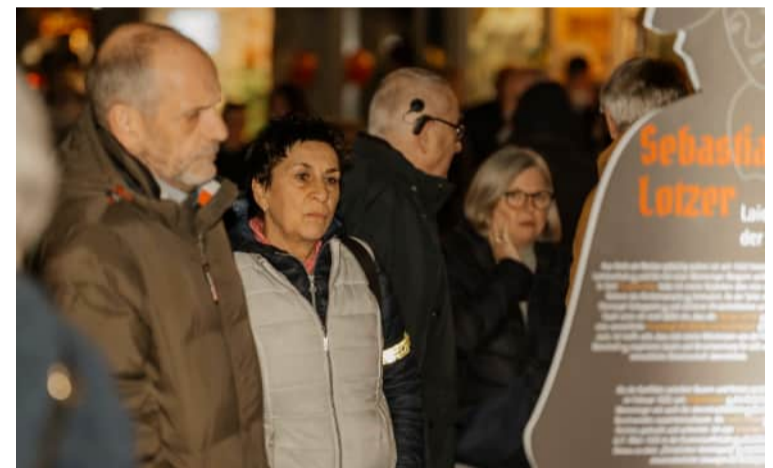
«Menschen 1525» (Infotainment im öffentlichen Raum)