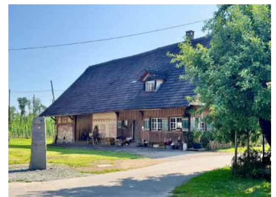
Stele für den Rappertsweiler Haufen