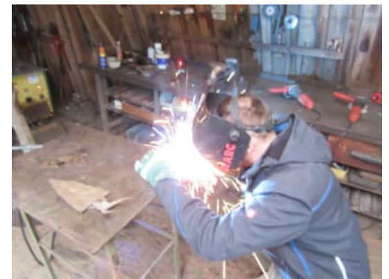
Kreative Auseinandersetzung mit dem Thema bei einem Schulprojekt