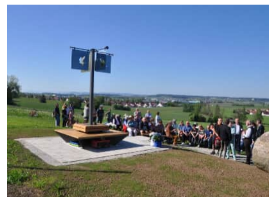
Kunstwerk Wolfertschwenden Einweihung am 1.5.2025