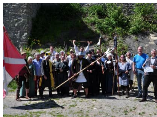
Komparsen in Sulzberg