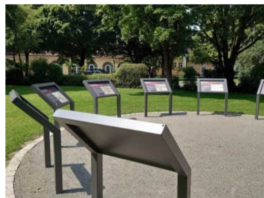
Stelen zur Weißenauer Chronik